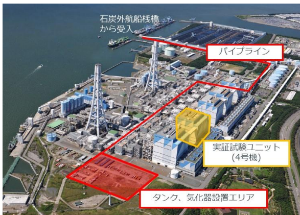
写真-1 プロジェクト① JERA 碧南火力発電所 4 号機